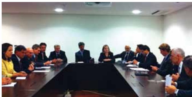
Reunião da bancada com o governo federal